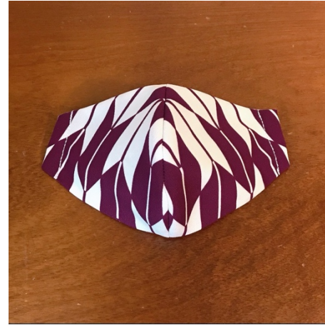
Modèle 74 – Polyester à kimono