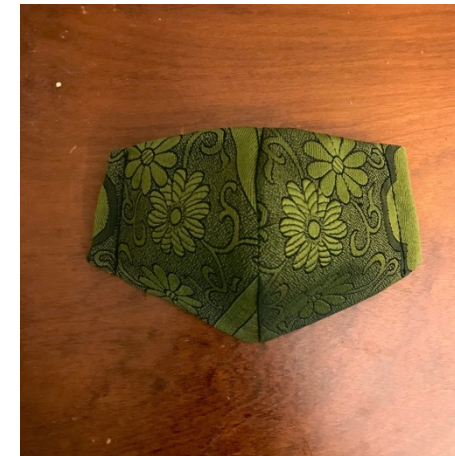
Modèle 36a – Polyester japonais tissé (motif)