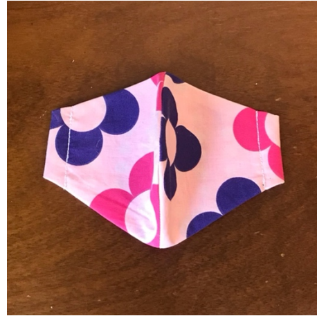
Modèle 72 – Coton à yukata