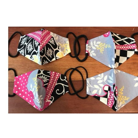
Modèle 54 – Coton à yukata