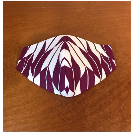
Modèle 74 – Polyester à kimono