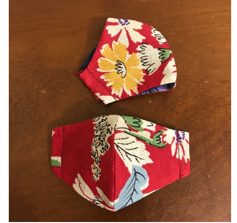
Modèle 69 – Coton à yukata