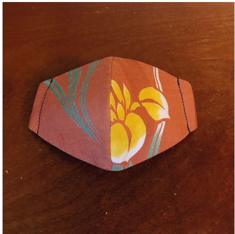
Modèle 71 – Coton à yukata