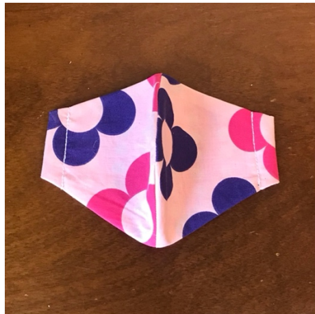
Modèle 72 – Coton à yukata