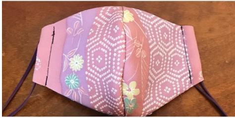
Modèle 9 Tissu synthétique à kimono