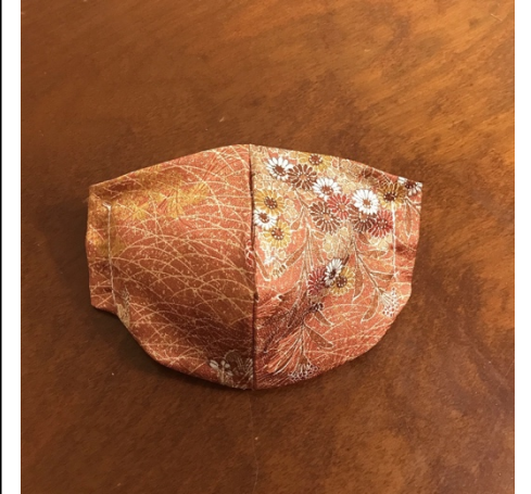
Modèle 29 Polyester à kimono