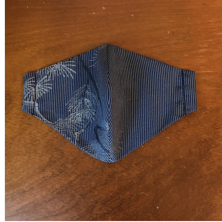
Modèle 27 100% soie (bleu) Lavage à la main