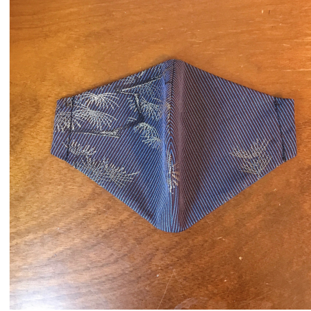
Modèle 28 100% soie (mauve) Lavage à la main