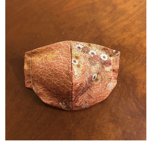
Modèle 29 Polyester à kimono