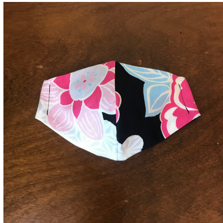
Modèle 33 – Coton à yukata