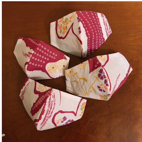
Modèle 70 – Coton à yukata