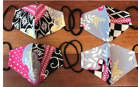
Modèle 54 – Coton à yukata