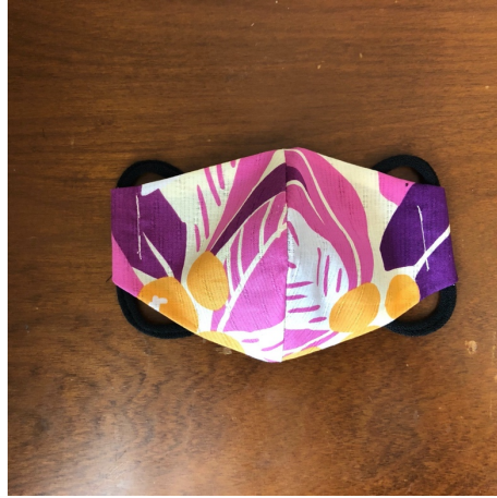
Modèle 51 – Coton à yukata