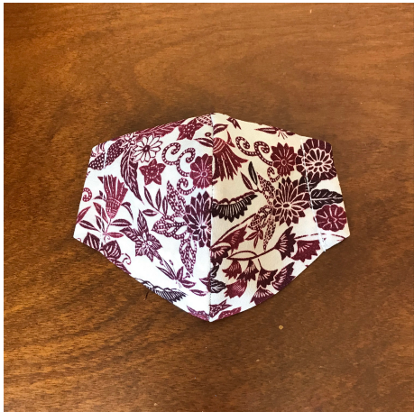
Modèle 31 – Mélange synthétique à kimono