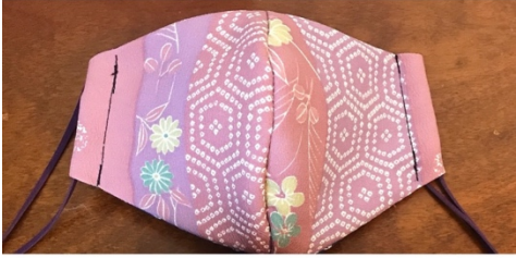
Modèle 9 Tissu synthétique à kimono