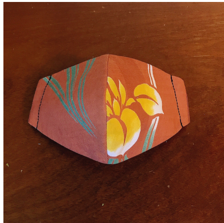
Modèle 71 – Coton à yukata