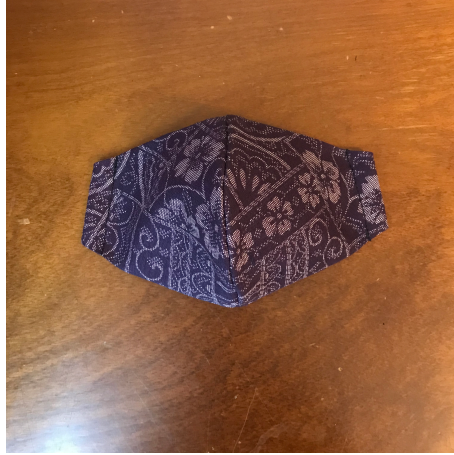
Modèle 24 Laine à kimono Lavage à la main