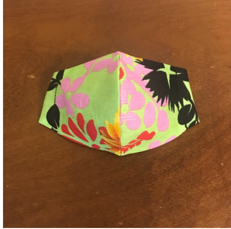
Modèle 40 – Coton et ramie (ortie de Chine) à yukata