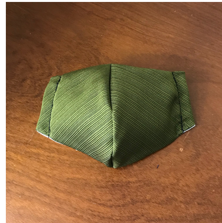
Modèle 36 – Polyester japonais tissé (sans motif)