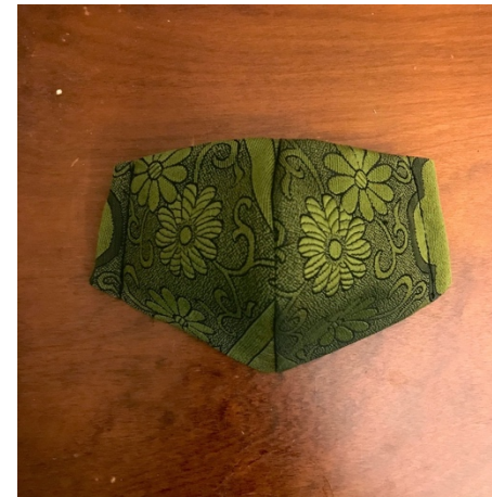
Modèle 36a – Polyester japonais tissé (motif)