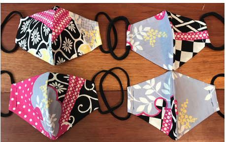
Modèle 54 – Coton à yukata