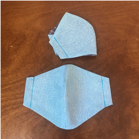
Modèle 68 – Poly, rayonne et ramie (ortie de Chine)