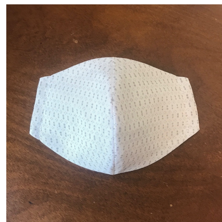
Modèle 58 – Polyester et ramie (ortie de Chine) à kimono