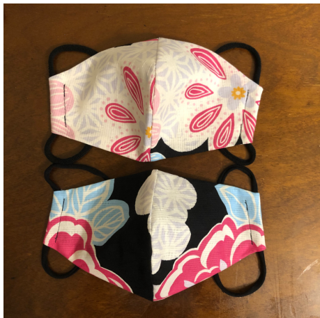
Modèle 33 – Coton à yukata