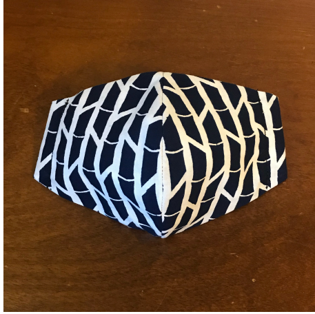
Modèle 64 – Coton à yukata