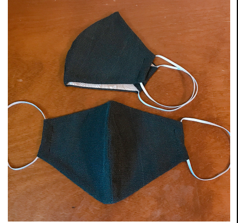
Modèle 67 – Soie et coton