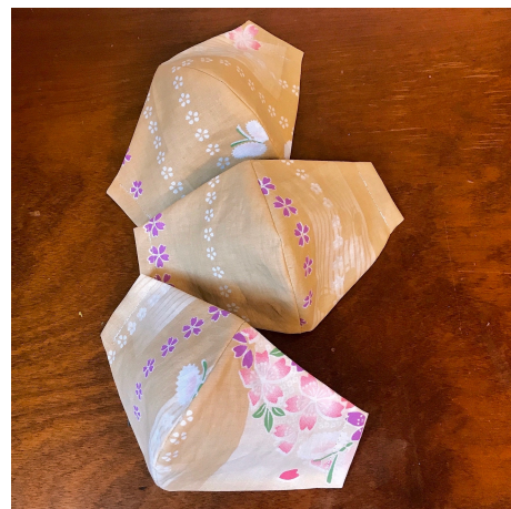
Modèle 56 – Coton à yukataş