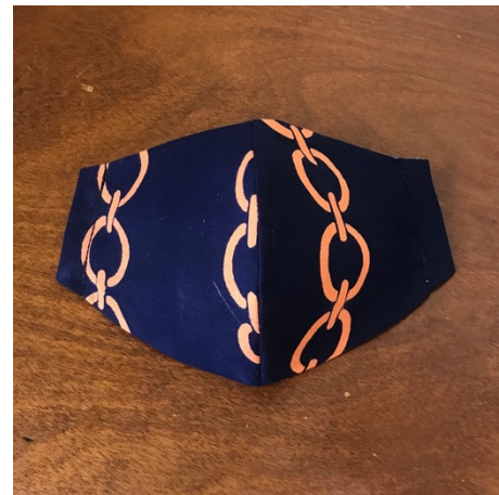
Modèle 38 – Coton à yukata