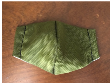
Modèle 36b – Polyester japonais tissé (sans motif)