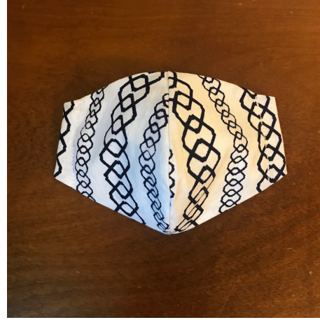
Modèle 65 – Coton et ramie à yukata