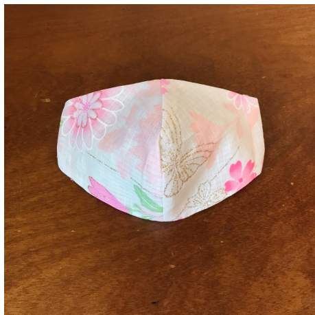
Modèle 55 – Coton à yukata