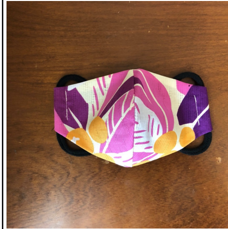
Modèle 51 – Coton à yukata