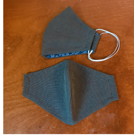
Modèle 66 – Soie et coton