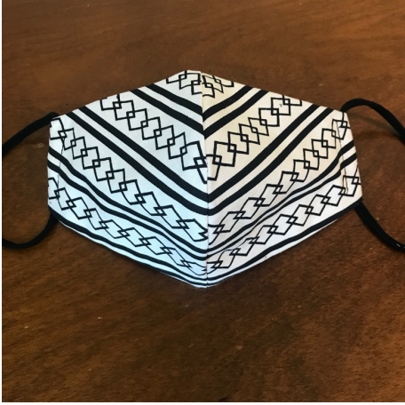
Modèle 62 – Coton à yukata