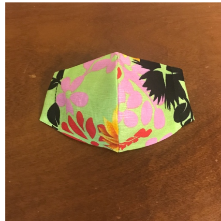
Modèle 40 – Coton et ramie (ortie de Chine) à yukata